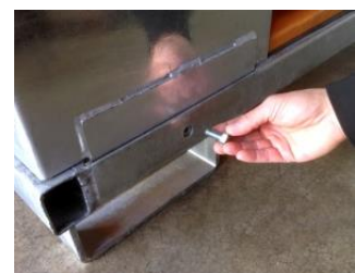
FIJACION DE CANTONERAS

* EMBALAJE DEL BOX: Mediante encaje, tornillería y pasadores