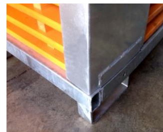
ENCAJE DE CANTONERAS