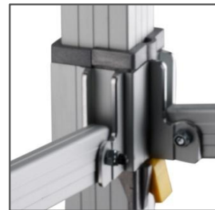
PULSADOR DE SEGURIDAD