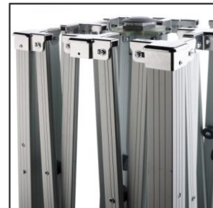
PIEZAS DE UNIÓN ALUMINIO FUNDIDO