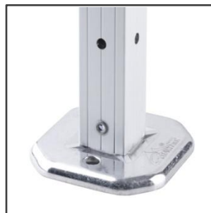
BASE REFORZADA DE ALUMINIO FUNDIDO