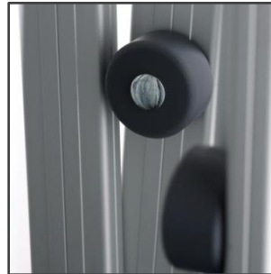
BOTÓN PROTECTOR TECHO