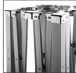
PIEZAS DE UNIÓN ALUMINIO FUNDIDO