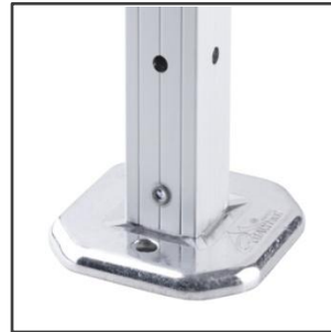
BASE REFORZADA DE ALUMINIO FUNDIDO