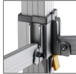
PULSADOR DE SEGURIDAD